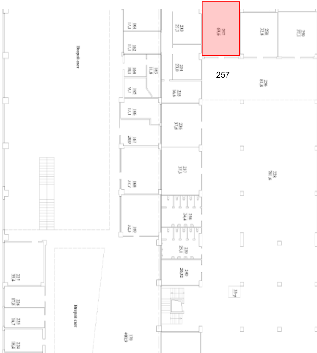
Схема расположения Помещения на _____ этаже _____

ПРИЛОЖЕНИЕ № 1 к договору аренды № _____ от « ____ » _____ 2016 г.