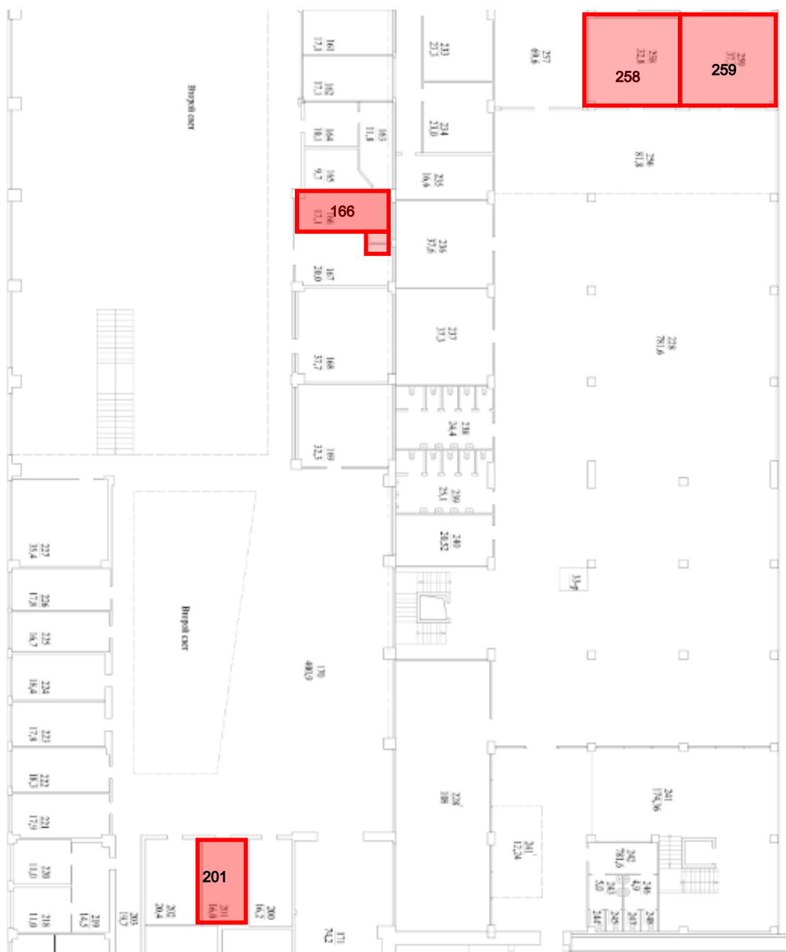
Схема размещения недвижимого имущества, объекта запроса предложений.