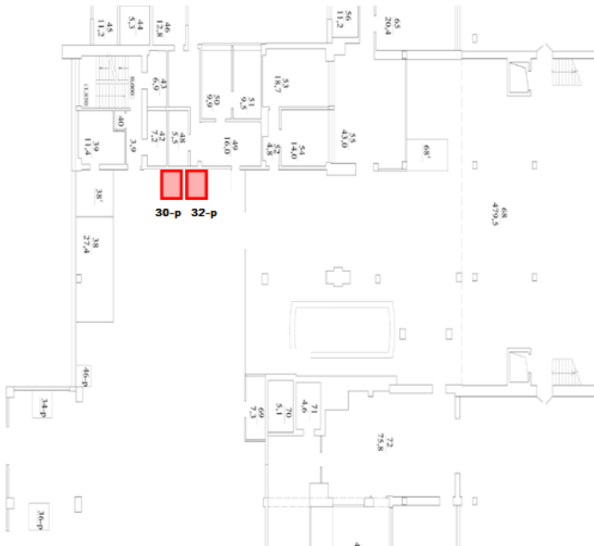
Схема расположения Оборудования на первом этаже здания аэровокзала, площадью ____ кв.м. Адрес расположения Оборудования: г. Астрахань, Советский район, Аэропортовская ул., 2, литер строения 70

АРЕНДОДАТЕЛЬ Генеральный директор ОАО «Аэропорт Астрахань»